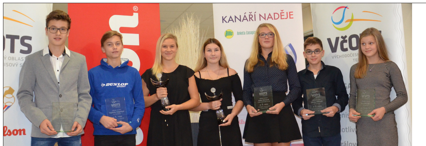
Nejlepší tenisté Východočeského oblastního tenisového svazu za uplynulý rok